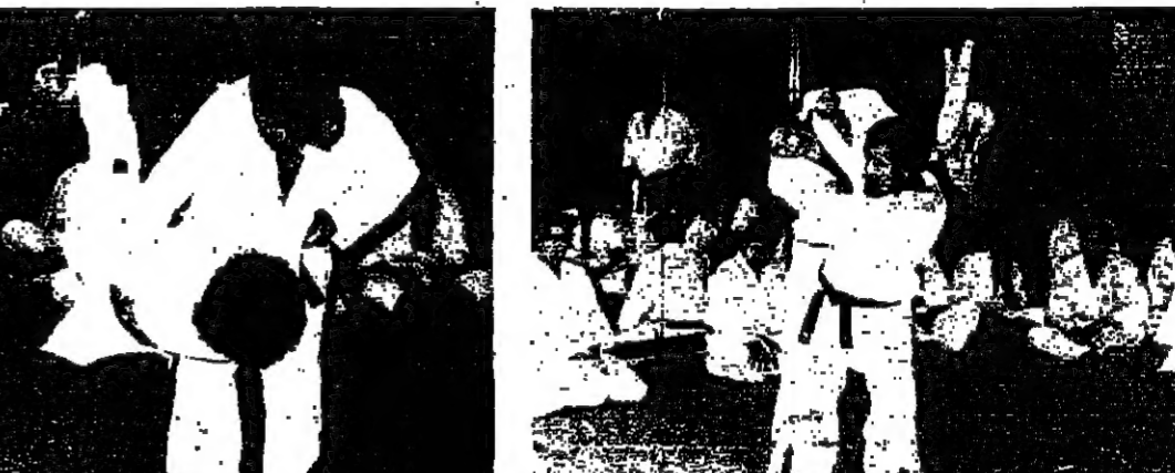
نوكلي يسك يجدي الالعبات لتهيدا لتهيدا ارضا